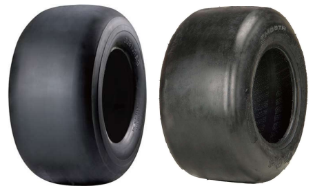
20x12,00-10 & 22x12,00-12