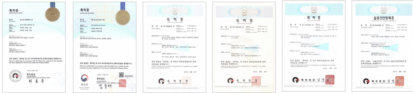
제 10-1598841호 제 10-2175477호 제 10-1068043호 제 10-1161048호 제 10-1446509호 제 20-0474692호