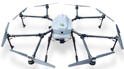
드론 기체 (SG-10P)