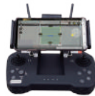
농업 전용 조종기