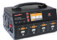
울트라파워 UP1200 충전기