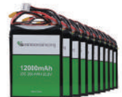
12,000mAh 6S 배터리 / 10ea