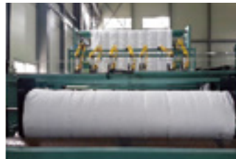
숨쉬는 다겹보온커튼 생산설비