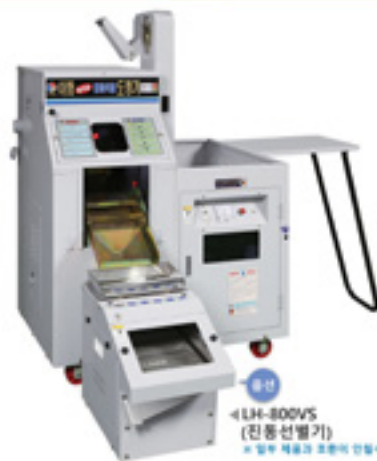
● 옵션 LH-800VS (진동선별기) * 일부 제조국 조립이 인접이 있습니다.