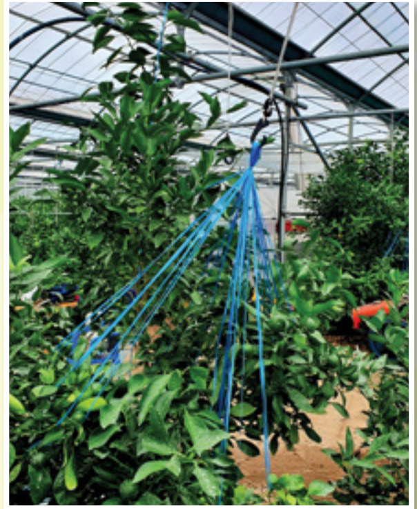
▲ 다인 굴고리 사용예(서귀포시 대정읍)